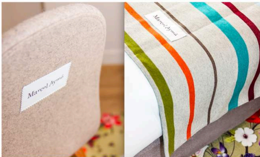
Les chaises, comme les dessus de lits, portent des étiquettes surpiquées au nom de l'écrivain.

Autrefois fréquenté par le dramaturge, le scénariste et l'essayiste français, le quartier Montmartre voit s'ouvrir un nouvel hôtel à son nom. Ses 39 chambres y racontent la vie de l'auteur des Contes du Chat Perché, de La Traversée de Paris et du Passe-Muraille, en offrant aux hôtes de passage un décor unique qui les plonge dans son univers particulier, à grands renforts d'éditions originales, d'affiches de films, de théâtre, et d'une bibliothèque multilingue de plus de 500 livres. 16, rue Tholozé, 75018 Paris. Tél. : 01 42 55 05 06 et www.montmartre-addict.com/hotel-marcel-ayme