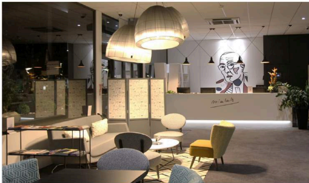
Le desk d'accueil affiche le portrait du grand auvergnat que fut Alexandre Vialatte.