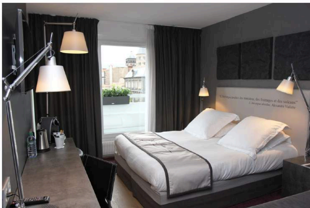
Dans toutes les chambres, une phrase tirée de l'un de ses livres rappelle sa poésie mêlée d'humour.